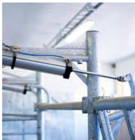
Duplex cilinder voor frontuitgang en indexering