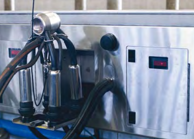
Strakke afwerking van het onderkabinet