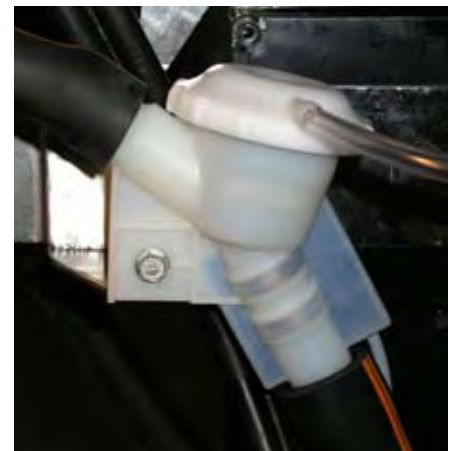
De HFC melkstromsensor heeft eveneens geen bewegende delen