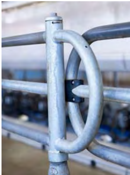
Positiehek met massieve bumper en interne veer

Er kan ook gekozen worden voor een kelder onder de melkput of de koestand. De melkleiding met de melkmeters en pulsators bevindt zich in de kelder en wordt via muurdoorvoeren aangesloten op de melkstellen. De apparatuur blijft droog en schoon, service is eenvoudig uit te voeren en het geluid van de pulsatoren en de melkpomp is niet te horen in de melkruimte.