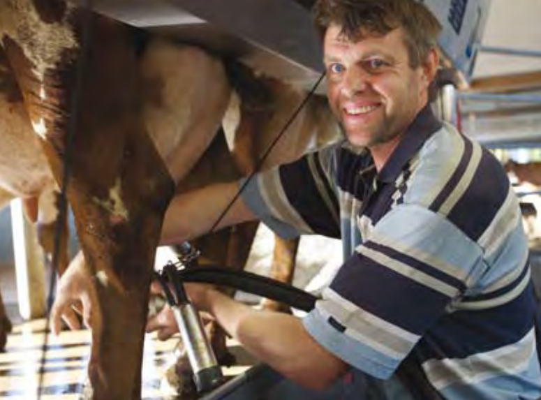
DeLaval P2100 - optimaal koecomfort