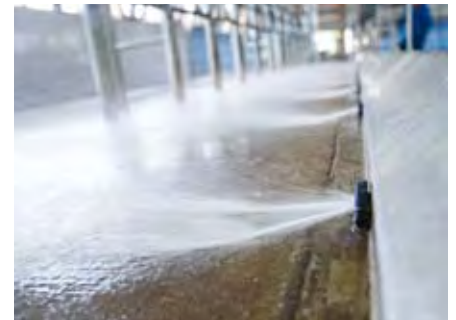
Deckflush nozzles zorgen voor een schone werkruimte