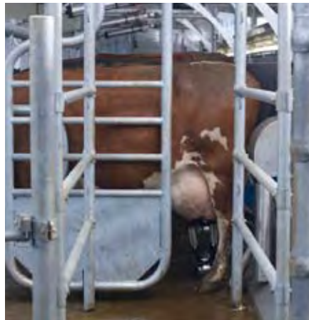
Het schuifhek duwt de laatste koe zachtjes op haar plaats

Het koecomfort gaat ook door bij het wisselen. Doordat de koe de kop niet hoeft op te tillen over een horizontale borstrail, kan ze ongehinderd vooruitstappen zodra de indexering wegvalt en de borstrail naar boven begint te bewegen. Een vlotte koewissel zonder stress is het resultaat.