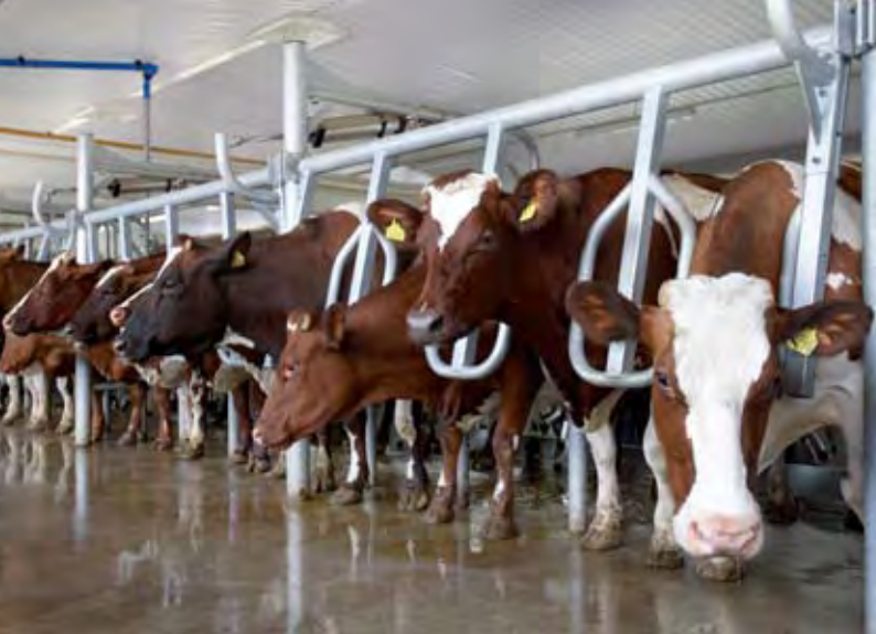
Natuurlijke stand tijdens het melken