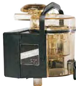
MM15 weegt de melk

De melk- en pulsatieslang worden aangesloten op nippels zodat er een vast verbindingspunt bestaat en de apparatuur beschermd is tegen beschadiging. De monsternamen kunnen worden aangesloten door het open deurtje.